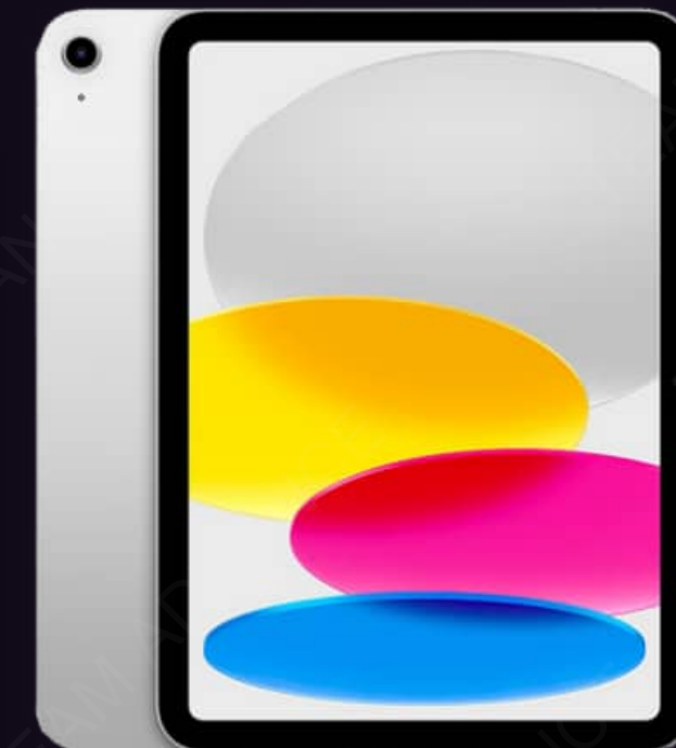
TABLET APPLE IPAD 11