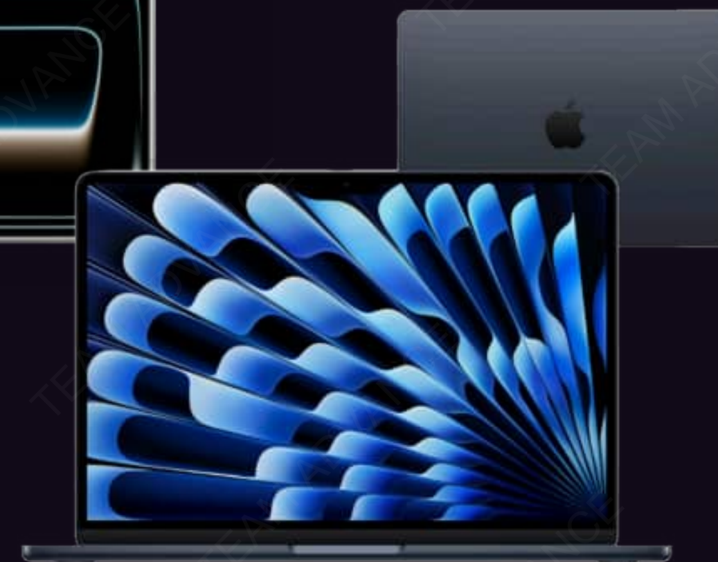
APPLE MACBOOK AIR 13