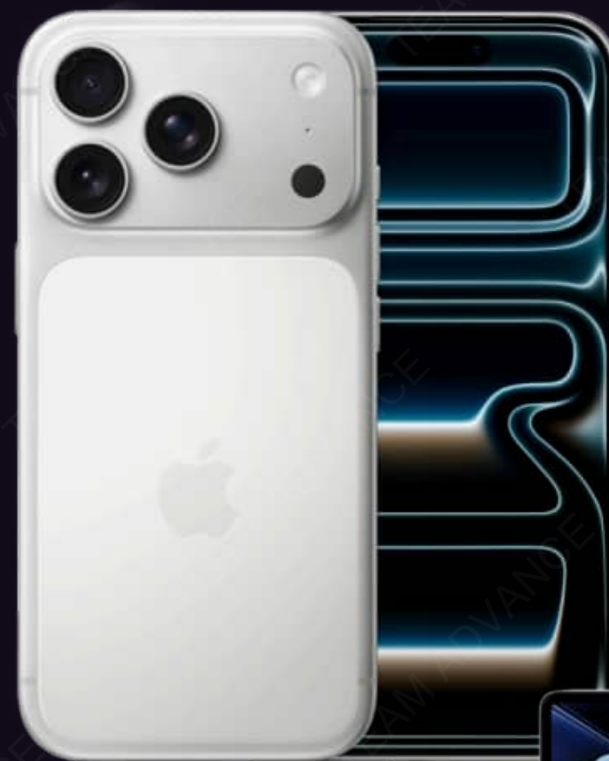
IPHONE PRO MAX 17